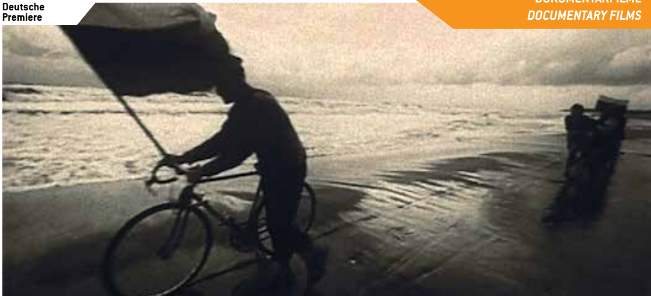
Litauen, Frankreich 2011, 69 Min., DCP, lit./russ./engl. OF, engl. UT