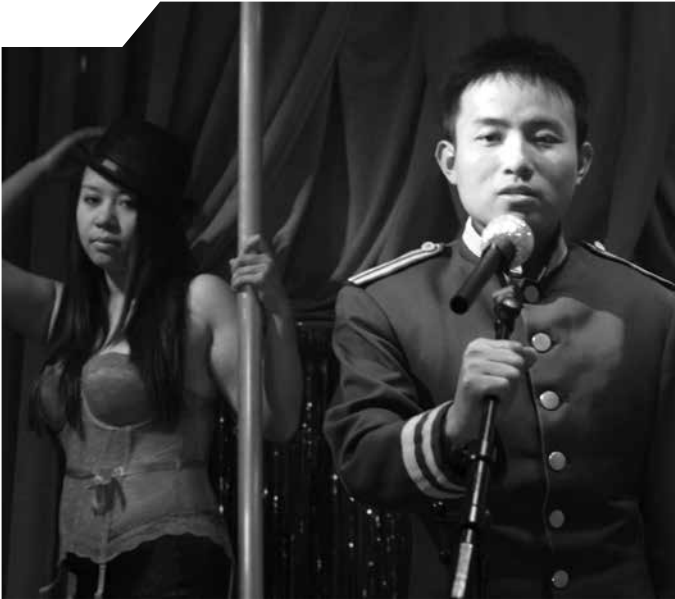
Deutschland 2011, 7 Min., 35 mm, ohne Dialog